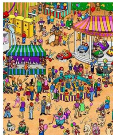
La serie sobre Wally ha inspirado la investigación, dirigida por una gallega

Los resultados revelan una conexión directa entre los movimientos del ojo y la forma en que los humanos exploramos escenas para encontrar objetos de interés. Este descubrimiento puede ayudar a comprender los mecanismos neurales subyacentes a la exploración visual, tanto en el cerebro normal como en pacientes con déficits visuales y oculomotores. También abre la vía para el diseño de futuras prótesis neurales para pacientes con daño cerebral, al tiempo que puede proporcionar información crítica para mejorar el diseño de los dispositivos de visión artificial.