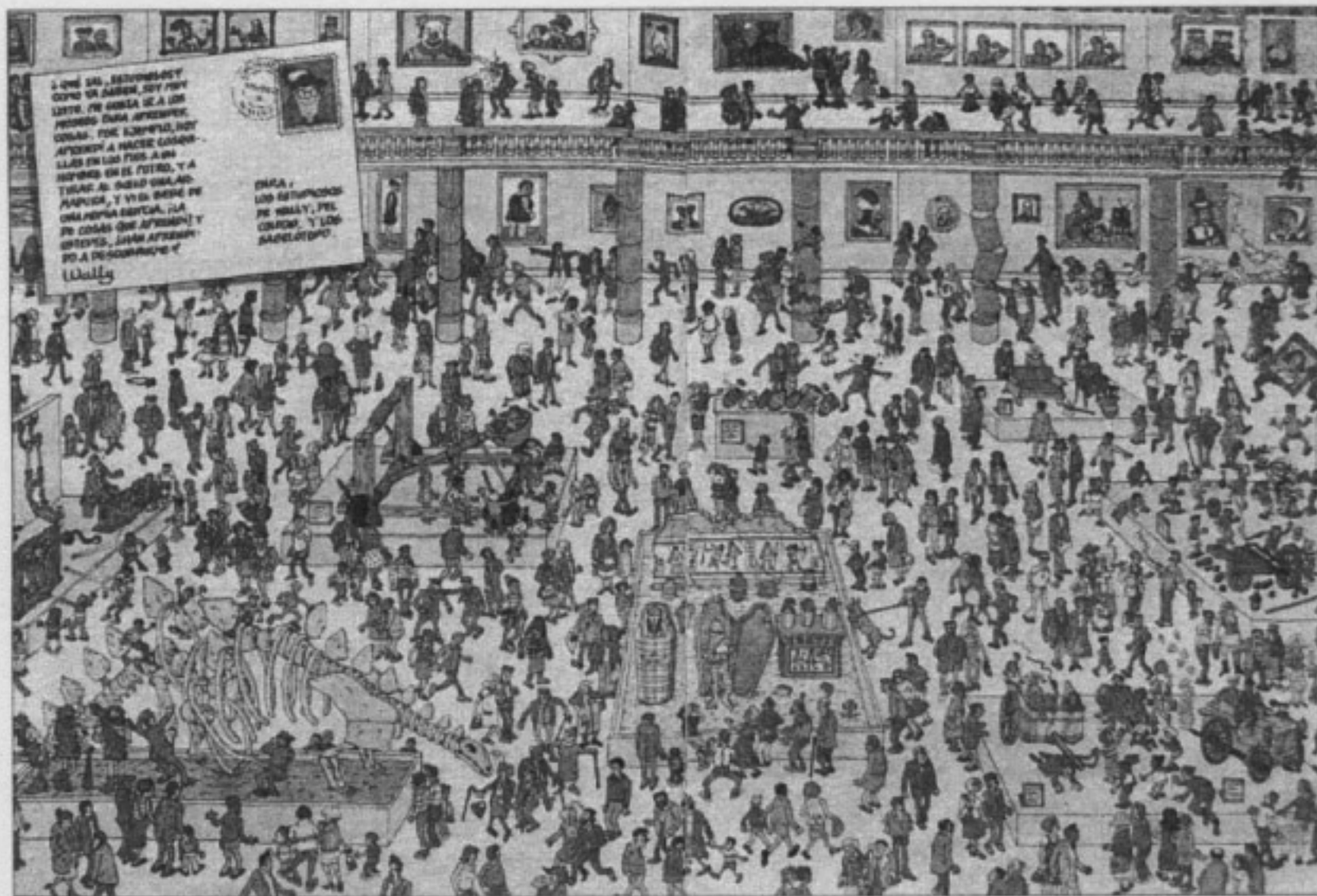
Un dos múltiples destinos nos que se perde o famoso personaxe Wally, neste caso un museo